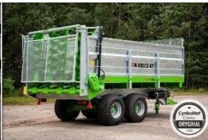
A4VS – 4 вертикальных шнека