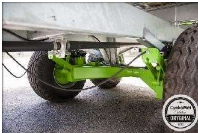
Рычажная тандемная подвеска