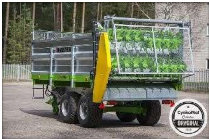
A2HS - 2 горизонтальных шнека