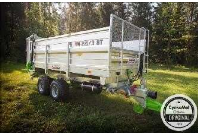
Комплект дополнительных надставных бортов 800мм