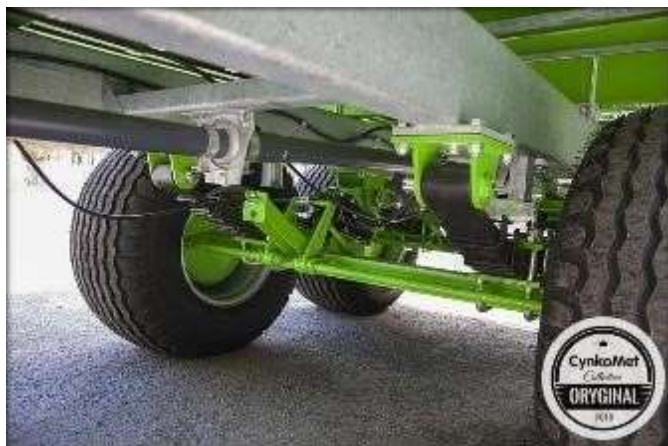
Рессорная тандемная подвеска