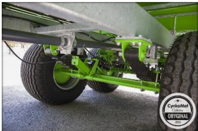
Тандемная рессорная подвеска