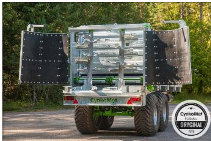
В рабочем положении