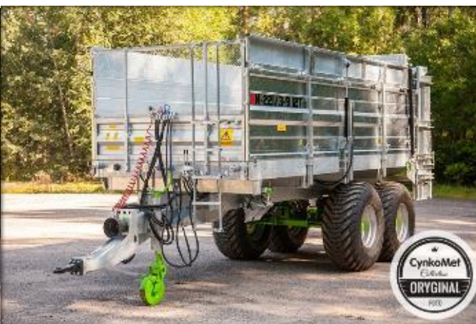
Борты 1000 + 350мм Полезная ёмкость кузова 15,3м3. Агрегатирование с МТЗ-1221