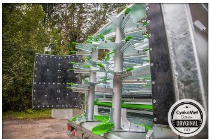
2 вертикальных пластинчатых разбрасывающих шнека А2V