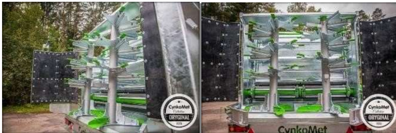
2 вертикальных пластинчатых разбрасывающих шнека A2V