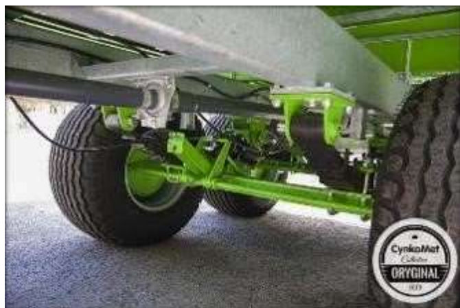
Тандемная рессорная подвеска