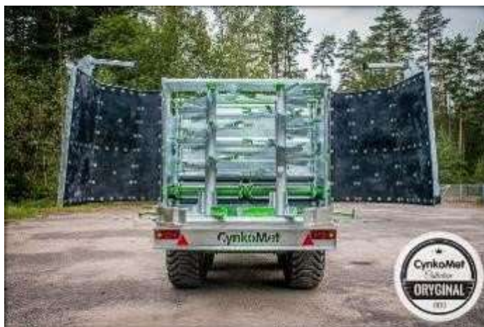
В рабочем положении