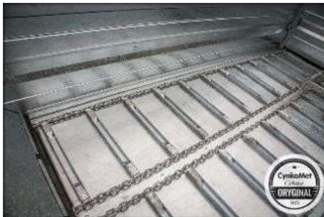
Цепной транспортер горячей оцинковки (14мм). Пол из сменных оцинкованных пластин толщины 4мм