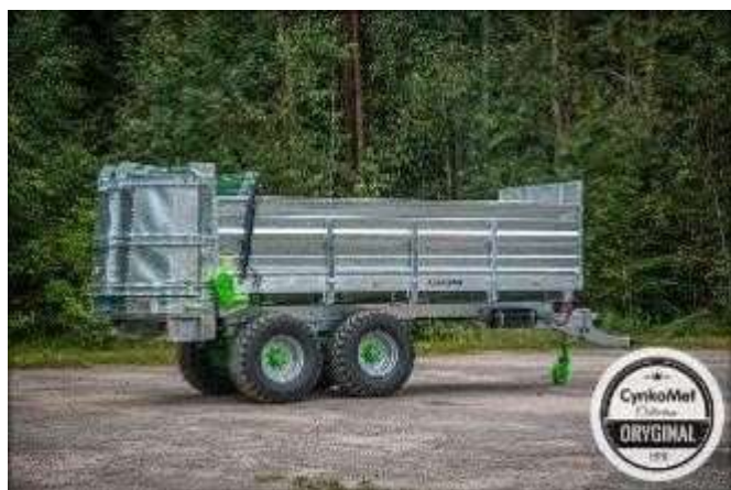
Агрегатирование с МТЗ-1221