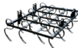
Зуб пружинный 32x12