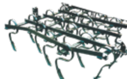
Зуб пружинный 25x8