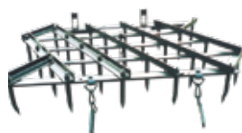
Зуб жесткий прямой